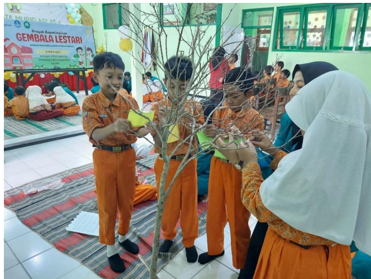
Gambar 5.3 Hasil Penerapan Pohon Harapan

Hasil dari kegiatan ini adalah peserta didik dapat menuliskan apa yang ia pikirkan ke dalam media kertas dan digantungkan ke Pohon Harapan. Pohon Harapan dapat dijadikan monumen/symbol semangat literasi peserta didik SD Negeri Dinoyo 1. Terlihat pada Gambar, semangat peserta didik dalam mengikuti kegiatan Pohon Harapan ini. Kegiatan ini melatih peserta didik untuk mengungkapkan harapan dan cita-citanya dalam bentuk tulisan. Kegiatan tersebut juga berdampak positif bagi peserta didik, agar terus memiliki keinginan dalam hidupnya. Sehingga motivasi dalam belajar untuk mencapai cita-citanya akan meningkat.