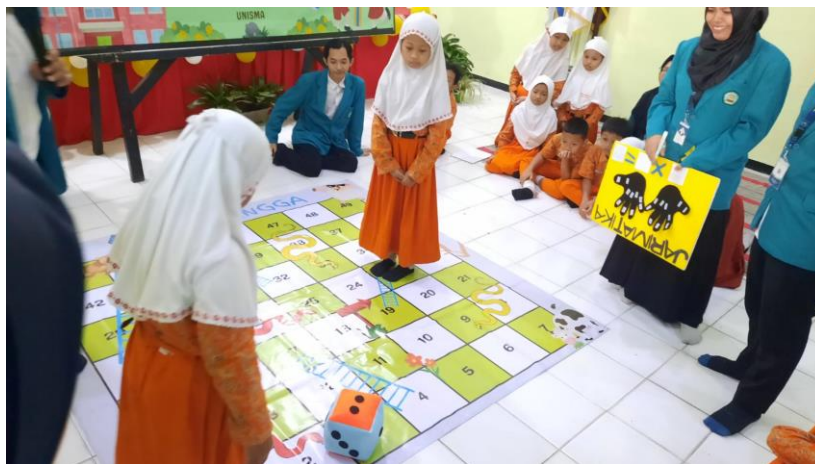
Gambar 5.5 Lomba Ular Tangga Perwakilan Kelompok

Pada pelaksanaan permainan ular tangga besar ini, peserta didik terlihat sangat semangat dan senang. Hal ini dikarenakan ular tangga besar memfasilitasi peserta didik untuk belajar sambil bermain. Ular tangga besar ini didesain sebagai media edukatif yang dilengkapi dengan soal yang dapat meningkatkan kemampuan numerasi peserta didik yang berisikan soal-soal matematika. Kegiatan ini merupakan kegiatan terakhir dalam rangkaian kegiatan GEMBALA LESTARI di SD Negeri Dinoyo 1.