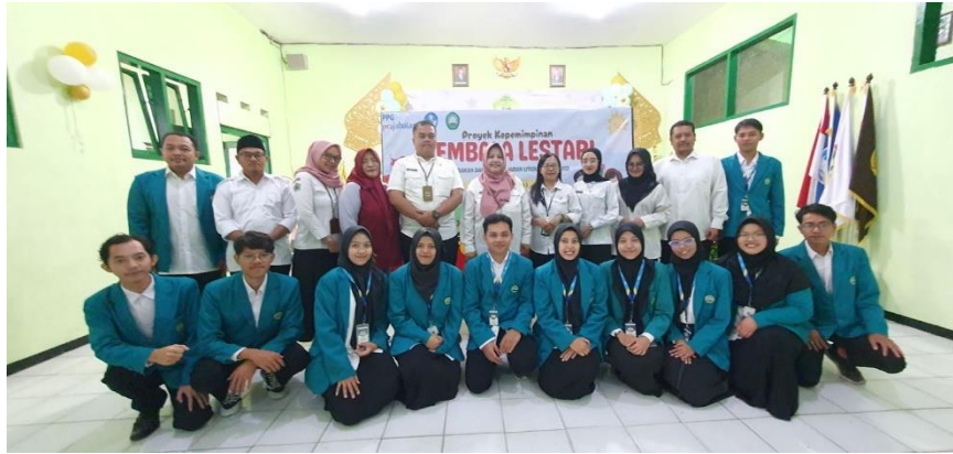
Gambar 5. 6 Foto Bersama Seluruh peserta didik Dan Dewan Guru

Setelah seluruh kegiatan pembelajaran Literasi dan Numerasi selesai, diadakan evaluasi tentang kegiatan yang telah dilakukan oleh mahasiswa PPG Prajabatan Gelombang 2 Tahun 2023. Evaluasi dilakukan dengan menyiapkan angket yang disampaikan melalui Google Form. Angket evaluasi kegiatan akan ditujukan kepada pihak mitra diantaranya Kepala Sekolah SD Negeri Dinoyo 1, bapak ibu guru maupun staff dan juga siswa siswi kelas 3 SDN Dinoyo 1 Malang selaku peserta kegiatan gerakan Literasi dan Numerasi. Secara keseluruhan kami sangat senang bisa diizinkan untuk mengadakan kegiatan berupa penerapan media pembelajaran berupa Jarimatika dan Ultrasi, pada saat kegiatan pelaksanaan peserta didik di SD Negeri Dinoyo 1 Malang juga terlihat sangat antusias dalam mengikuti seluruh rangkaian kegiatan. Berikut akan kami sajikan hasil angket evaluasi terkait keterlaksanaan kegiatan Literasi dan Numerasi.