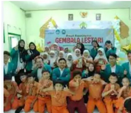
Foto Bersama Bapak dan Ibu Guru SD Negeri 1 Dinoyo

Foto Bersama dengan Peserta Didik SD Negeri 1 Dinoyo