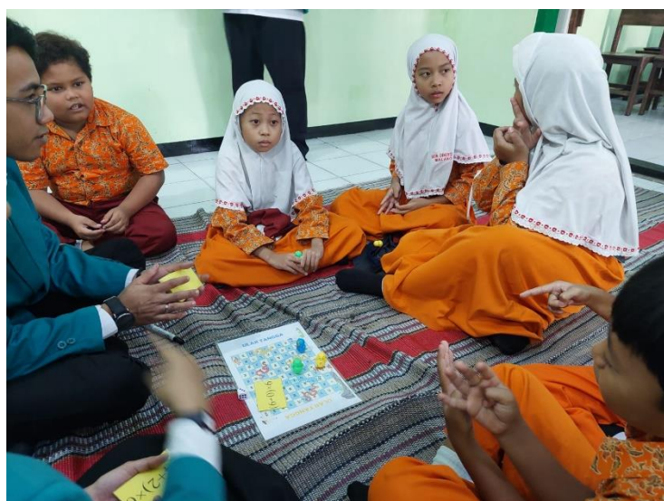
Gambar 5.4 Hasil Penerapan Ular Tangga Numerasi

Kegiatan Ular Tangga Numerasi (Ultras) merupakan salah satu rangkaian kegiatan GEMBALA LESTARI yang dilaksanakan di SD Negeri Dinoyo 1 pada hari Rabu, 12 Juni 2024. Kegiatan ini dilaksanakan bersamaan dengan penerapan media pembelajaran JARIMATIKA. Setelah peserta didik belajar mengenai media pembelajaran JARIMATIKA, peserta didik dapat menerapkannya di kegiatan Ular Tangga Numerasi.