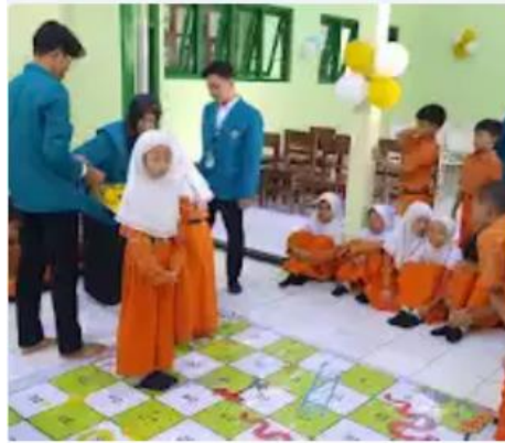
Pemenang Lomba Ular Tangga

Perlombaan Ular Tangga Besar Setiap Perwakilan Kelompok