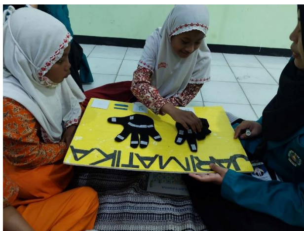
Gambar 5.3 Hasil Penerapan Pohon Harapan

diharapkan dapat terus dilaksanakan secara berkala untuk menumbuhkan minat berhitung dan meningkatkan numerasi peserta didik di SD Negeri Dinoyo 1.