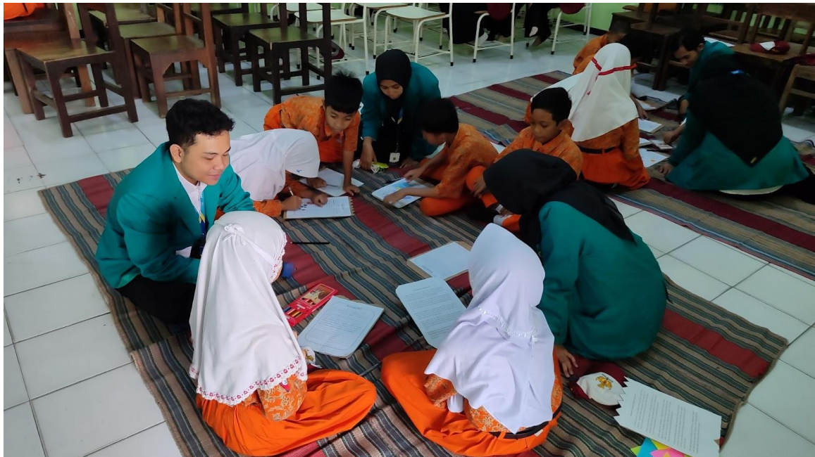
Gambar 5.2 Pendampingan Membaca Senyap dan Pojok Baca

Kegiatan Pendampingan Membaca Senyap dan Pojok Baca yang dilaksanakan pada hari Rabu, 12 Juni 2024 di SD Negeri Dinoyo 1 berjalan dengan lancar dan mencapai tujuannya. Peserta didik kelas 3 sangat antusias dan terlibat aktif dalam setiap tahap kegiatan. Mereka tidak hanya meningkatkan kemampuan literasi mereka, tetapi juga mengekspresikan kreativitas melalui kegiatan menghias hasil ringkasan. Kegiatan ini diharapkan dapat terus dilaksanakan secara berkala untuk menumbuhkan minat baca dan meningkatkan literasi peserta didik di SD Negeri Dinoyo 1.