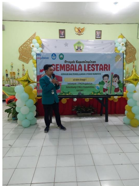
Gambar 5.1 Pemberian sambutan oleh ketua pelaksana proyek di SD Negeri Dinoyo 1

Kegiatan Gembala Lestari dilaksanakan pada tanggal 12 Juni 2024 dengan sasaran peserta didik kelas 3 SD Negeri Dinoyo 1. Pada hari itu, peserta didik kelas 3 tidak mengikuti pembelajaran di kelas, akan tetapi difokuskan mengikuti kegiatan Gembala Lestari. Kegiatan Gembala Lestari dilaksanakan dari jam 07.30 WIB hingga 11.00 WIB. Kegiatan ini diawali dengan pembukaan menyanyikan lagu Indonesia Raya dan sambutan-sambutan. Sambutan pertama dilakukan oleh Kepala SD Negeri Dinoyo 1 dan dilanjutkan dengan sambutan ketua pelaksana sekaligus penyerahan kenang-kenangan kepada SD Negeri Dinoyo 1. Ketua proyek kepemimpinan memberikan sambutan dengan memberikan motivasi kepada peserta didik dan memberikan arahan agar mengikuti kegiatan dari awal sampai akhir. Selain itu ketua proyek kepemimpinan menyampaikan latar belakang terlaksananya kegiatan, tujuan, dan manfaat kegiatan proyek kepemimpinan yang akan dilaksanakan. menunjukkan bahwa peserta didik memperhatikan dengan seksama rundown acara yang akan dilaksanakan.