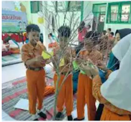
Ular Tangga Kecil “Gembala Lestari”